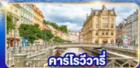
คาร์โรวารี