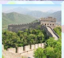
ตลาดร้อยปีเจิ้งหวิงเมี่ยว กำแพงเมืองจีน ด้านจวิจกวน