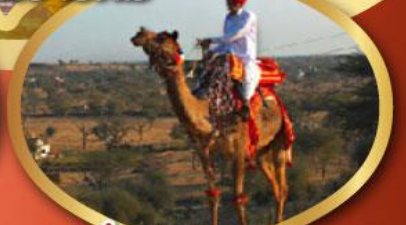
ฟรี จักรู เมืองมันทาวา ราคาเริ่มต้น