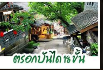
ตรอกบ้านไฉ่เซี่ยน