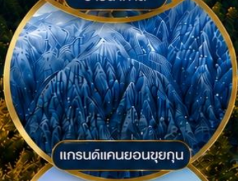
แกรนด์แคนยอนซุยกุณ