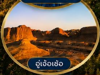
อู่เจ้อเซ่อ