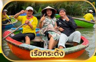
เรือกระดิ่ง