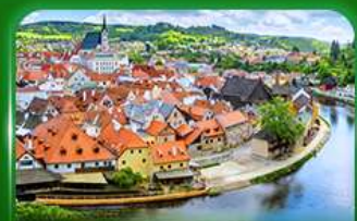
เมืองมรดกโลก เซสท์ครุมลอฟ