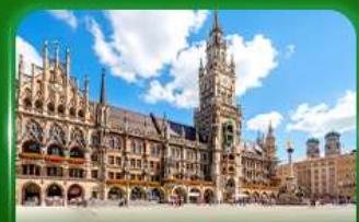
จัตุรัสมาเรียนพลัทซ์ มิวนิค