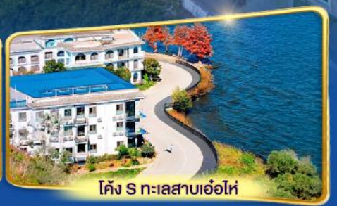
โค้ง S ทะเลสาบเอ่อไห่