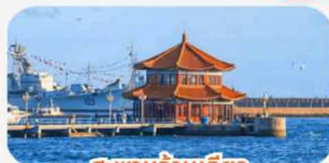
สะพานฉานเจียว