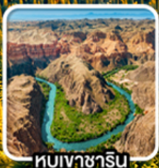
หุบเขาซาริน