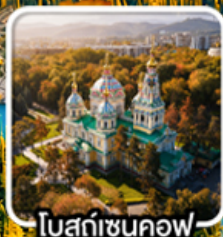
โบสถ์เซนคอฟ

นั่งกระเช้าคอนโดล่าขึ้นสู่ชิมบูลัก สตรีสออร์ก ไร่มุกแห่งเทือกเขาเทียนชาน ทะเลสาบโคลโซ หุบเขาเจดี ไอกูซ / ภูเขาหินเทพนิยาย / ทะเลสาบอัสซิกกุล ชมการแสดงการล่าเหยื่อของนกอินทรี