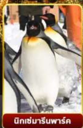
มิทซ์มารีนพาร์ค