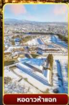
หอดาวห้าแฉก

ออนเซ็น 3 คั้น มน.กระเป๋า 1 ใบ 23 กก 7Days 5Night