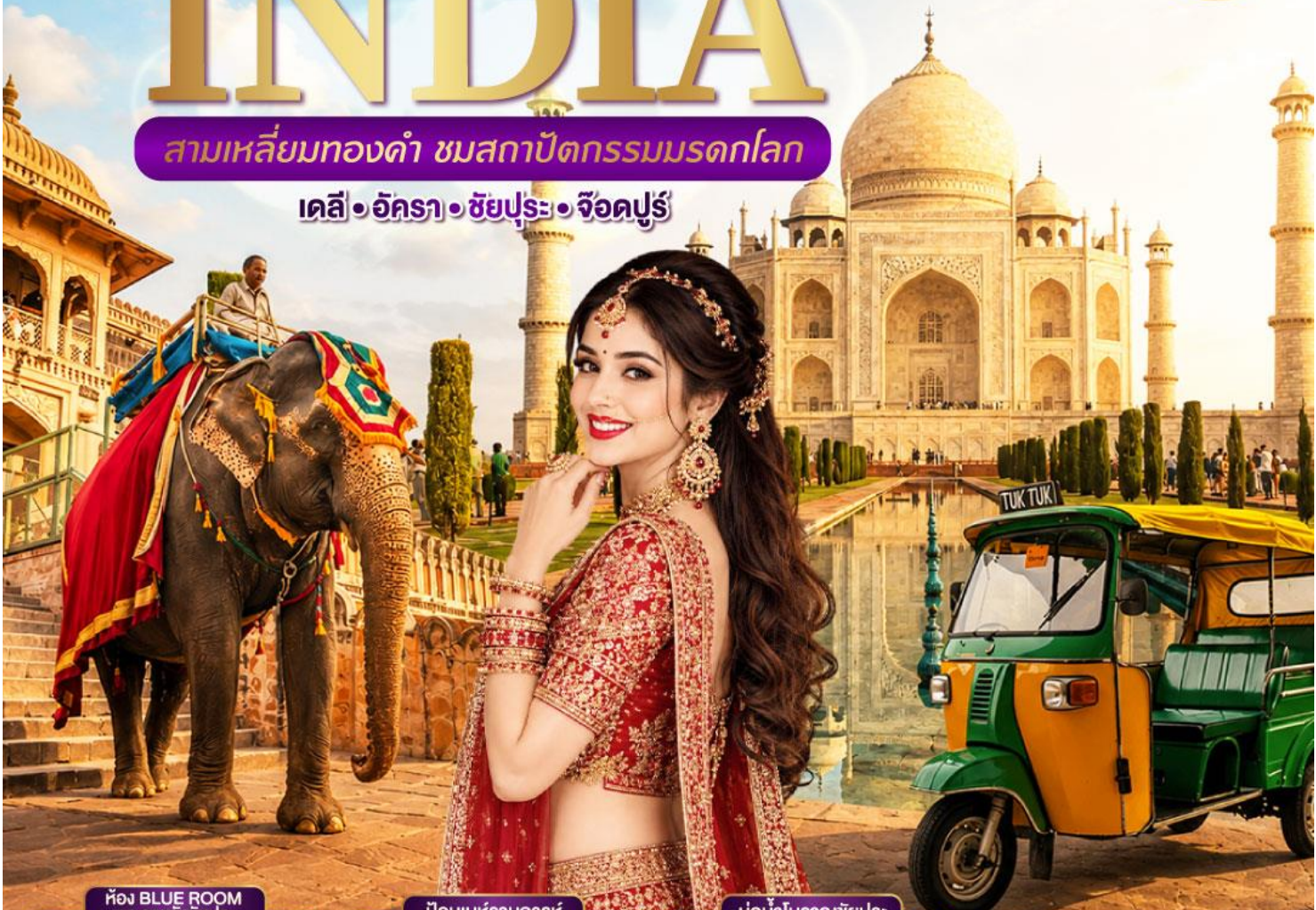
ห้อง BLUE ROOM พระราชวังชัยปุระ