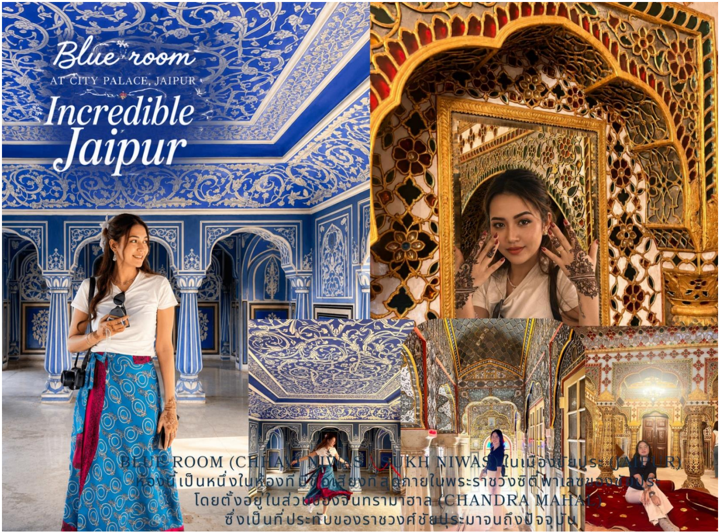
BLUE ROOM (CHANDRA NIWAS) AT CITY PALACE, JAIPUR ห้องนี้เป็นหนึ่งในห้องที่สวยงามที่สุดในพระราชวังซิตี้พาลาซของเมือง โดยตั้งอยู่ในส่วนของจันทรมาฮาล (CHANDRA MAHAL) ซึ่งเป็นที่ประทับของราชวงศ์ชัยปุระมาจนถึงปัจจุบัน

กลางวัน รับประทานอาหารกลางวัน ณ ที่ห้องอาหาร (มื้อที่ 4) จากนั้นเชคเอาท์ สัมภาระ ออกเดินทางสู่เมือง จอดห์ปุร์ ใช้เวลานั่งรถ 5.30 ชม. เมืองโยธะปุระ (JODHPUR) เมืองที่มีขนาดใหญ่เป็นอันดับสองในแคว้นราชาสถาน ถูกขนานนามว่า มหานครสีฟ้า BLUE CITY และนครแห่งนักรบ ซึ่งการที่บ้านเรือนมีสีฟ้าอันมีสาเหตุเนื่องมาจากมี ความเชื่อว่า สีฟ้าจะช่วยกันแมลงและทำให้บ้านเย็นขึ้น