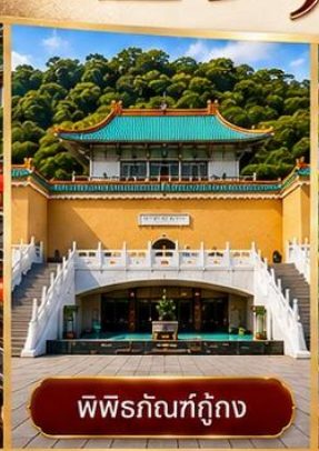
พิพิธภัณฑ์กู่กวง