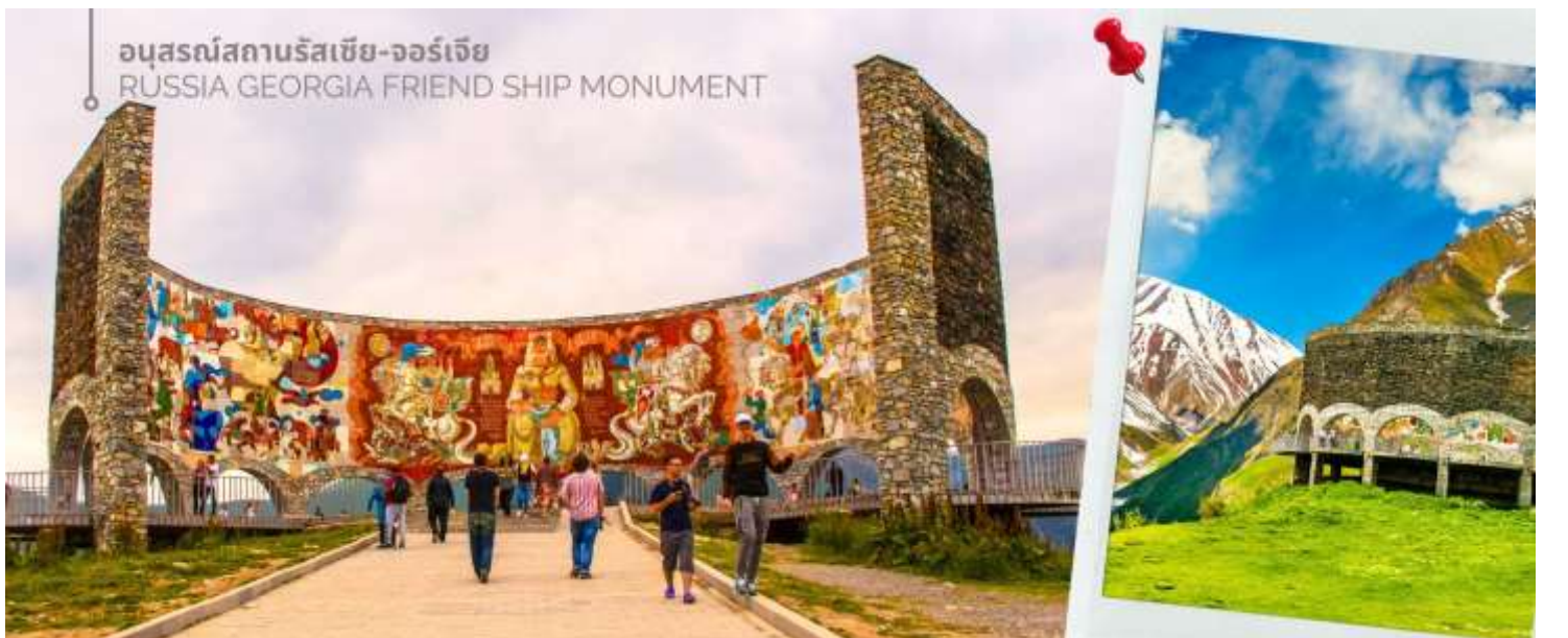
อนุสรณ์สถานรัสเซีย-จอร์เจีย RUSSIA GEORGIA FRIEND SHIP MONUMENT

จากนั้นนำท่านแวะถ่ายภาพและชมความงามของ อนุสรณ์สถานรัสเซีย-จอร์เจีย (RUSSIA GEORGIA FRIEND SHIP MONUMENT) เป็นอนุสรณ์หินคอนกรีตทรงกลมขนาดใหญ่ สร้างขึ้นในปี ค.ศ. 1983 เพื่อเฉลิมฉลองครบรอบ 200 ปีของสนธิสัญญาจอร์จีฟสกี (Treaty of Georgie ski) ซึ่งเป็นการแสดงถึงความสัมพันธ์อันดีระหว่างรัสเซียและจอร์เจียในช่วงเวลานั้น อนุสรณ์สถานนี้มี ความสูงประมาณ 20 เมตร และถูกออกแบบในสไตล์สถาปัตยกรรมโซเวียต ตัวอาคารมีรูปทรงกลมขนาดใหญ่ ภายในตกแต่งด้วยกระเบื้องโมเสกสีสันสดใส ซึ่งบอกเล่าเรื่องราวประวัติศาสตร์และวัฒนธรรมของทั้งสองชาติ ตั้งอยู่บนเส้นทางระหว่างเมืองกูตาอูรีและคาซเบกิ และทำเลบนยอดเขาสูง ทำให้เป็นจุดชมวิวที่สามารถมองเห็นทิวทัศน์อันงดงามของเทือกเขาคอเคซัสได้ ปัจจุบัน อนุสรณ์สถานแห่งนี้ยังคงตั้งอยู่ แต่ความหมายของมันได้เปลี่ยนแปลงไปอย่างสิ้นเชิง หลังจากการล่มสลายของสหภาพโซเวียต โดยเฉพาะอย่างยิ่งสงครามรัสเซีย-จอร์เจียในปี ค.ศ.2008 ทำให้ความสัมพันธ์ระหว่างสองประเทศตึงเครียดขึ้นอย่างมาก และส่งผลกระทบต่อความหมายของอนุสรณ์สถานแห่งนี้