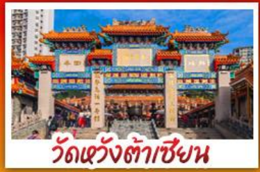
วัดเซ่งเต้าเซิน

วัดเจ้าแม่กวนอิมฮ่องฮำ - กระเช้านองปิง พระใหญ่โป่วหลิน - เจ้าแม่กวนอิมรพิลส์เบย์ วัดซำฮ่องกง, ห่านย่าง และอาหารชาบู