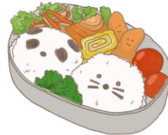
● อาหารสำหรับเด็ก ( 2-11 ปี ) *วัตถุดิบขึ้นอยู่กับทางร้าน