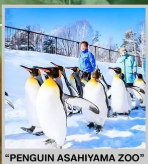
“PENGUIN ASAHIYAMA ZOO”