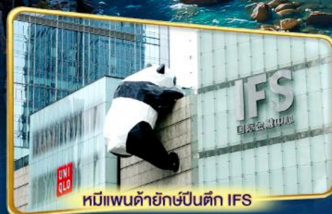
หมีแพนด้ายักษ์ปีนตึก IFS