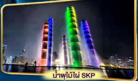
น้ำพุไม้ไฟ SKP