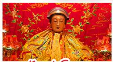
วัดเล่งจื๊อเมว