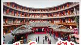
เมืองโบราณลั่วใต้