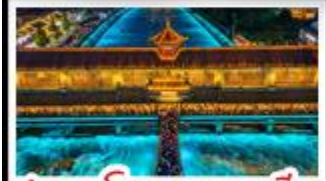
สะพานโบราณหนวยฮิว

อุทยานคำกู่ปิงชวณ - อุทยานสี่ดรุณี - หมี่แพนด้าเซลฟี่ ป่าฟิมิน่าตีกSKP - อุทยานปีศาจโทว - สะพานโบราณหนวยฮิว สตรีทอาร์ต Eastern Suburb Memory - เมืองโบราณลั่วใต้ เบมูพิศฆ มื้อโฟพมาล่า