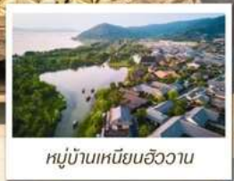
หมู่บ้านเหมียนฮิววาน

🧳 โหลด 23 KG. x1 ทั้งไป - กลับ ✓ พรีเมียมทัวร์ ✓ ไม่เข้าร้านรัฐบาล ✓ ทัวร์กรุ๊ปเล็ก ✓ รวมค่าเข้าชมตามที่ตามโปรแกรม