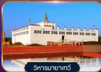
วิหารมายาเกวี