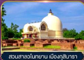
สวนสาละวินทยาน เมืองกุสินารา