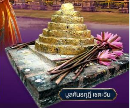
มุลคันธกุฎี เขตระวัน