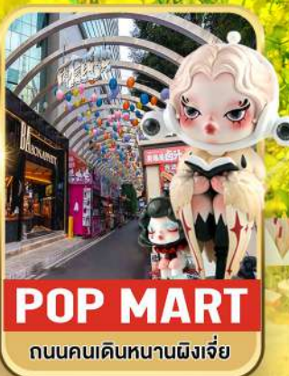
POP MART ถนนคนเดินหนานผิงเจี๋ย