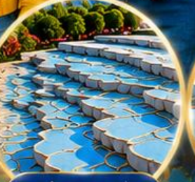
ปานุกคาล์ Pamukkale