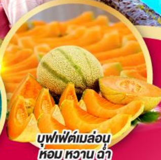
บุฟเฟ่ต์เมล่อน หอม หวาน ฉ่ำ