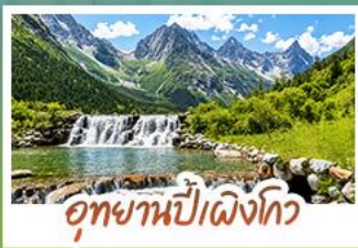
อุทยานปี่ผิงโกว