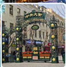
ถนนจางยาง