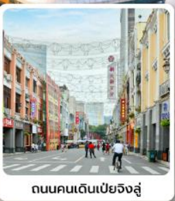
ถนนคนเดินเป่ย์จิงสู๋