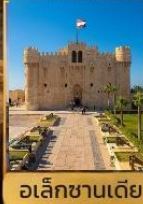
อเล็กซานเดีย