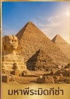
มหาพีระมิดกิซ่า