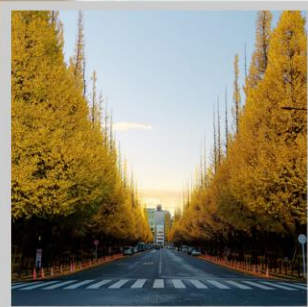
“ICHONAMIKI GINGO AVENUE”