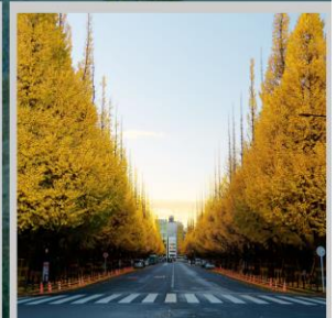
“ICHONAMIKI GINGO AVENUE”