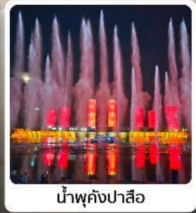
น้ำพุคังปาสือ