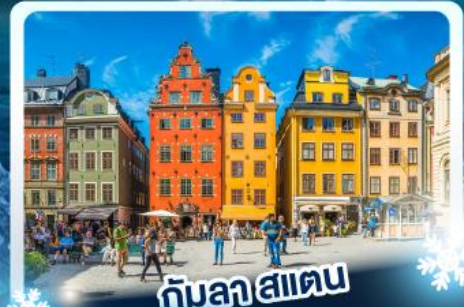
คิบลาสเตน