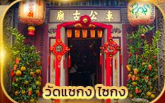
วัดเขกง ไชกง