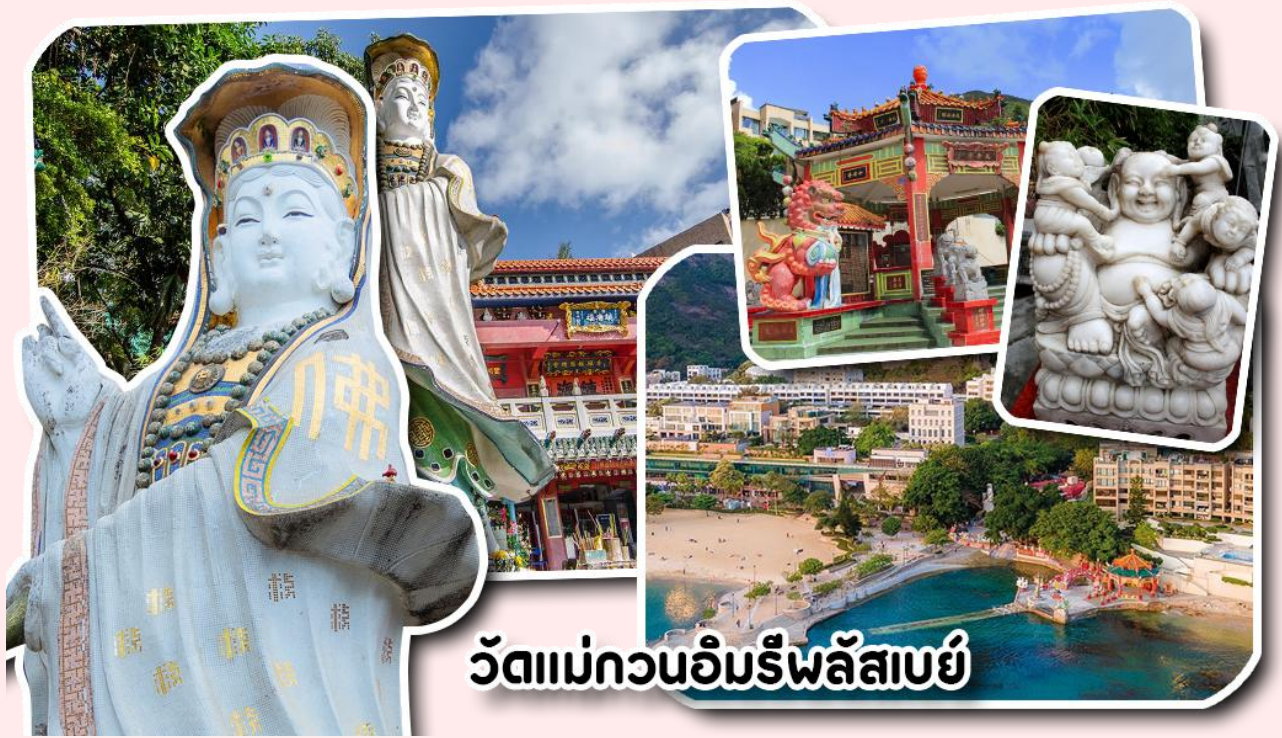
วัดแม่กวนอิมรีพลัสบาย

อยากได้ลูกสาวให้ลู่บ่ท้องขวา ถัดมาคือ เจ้าแม่ทับทิมเทพีแห่งท้องทะเล ท่านจะคอยคุ้มครองผู้เดินทางทางเรือ หรือผู้ที่เดินทางไปไหนมาไหนท่านจะคอยคุ้มครองให้ปลอดภัย และมีโชคลาภ ถัดจากบริเวณที่กราบไหว้ขอพร ก็จะมีศาลาแปดเหลี่ยมริมน้ำ และสะพานเล็กๆ ที่ชื่อว่าสะพานต่ออายุ ซึ่งเชื่อกันว่าหากเดินข้ามสะพานแห่งนี้ 1 ครั้ง ก็จะมีอายุยืนขึ้น 3 ปี