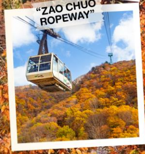
"ZAO CHUO ROPEWAY"