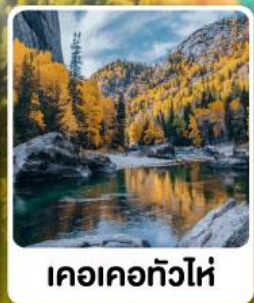
เคอเคอทัวไห่