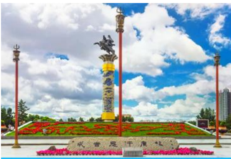
จัตุรัสเจงกิสข่าน

หลังอาหารนำท่านเดินทางสู่เมือง ไห่ลาเอ๋อ 海拉尔市 (ระยะทาง 456 กม. ใช้เวลาเดินทางราว 5 ชั่วโมงครึ่ง)