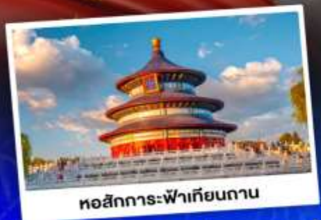
หอสังเกตการณ์เทียนถาน