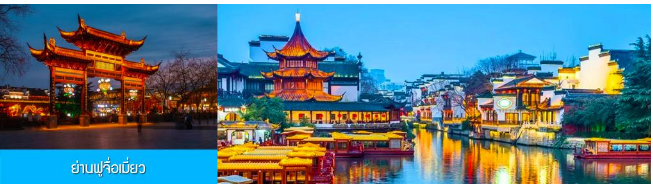
ย่านฟูจื่อเมี่ยว