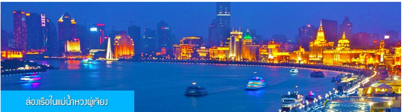
ล่องเรือในแม่น้ำหวงผู่เจียง