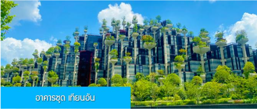
อาคารชุด เทียนอัน