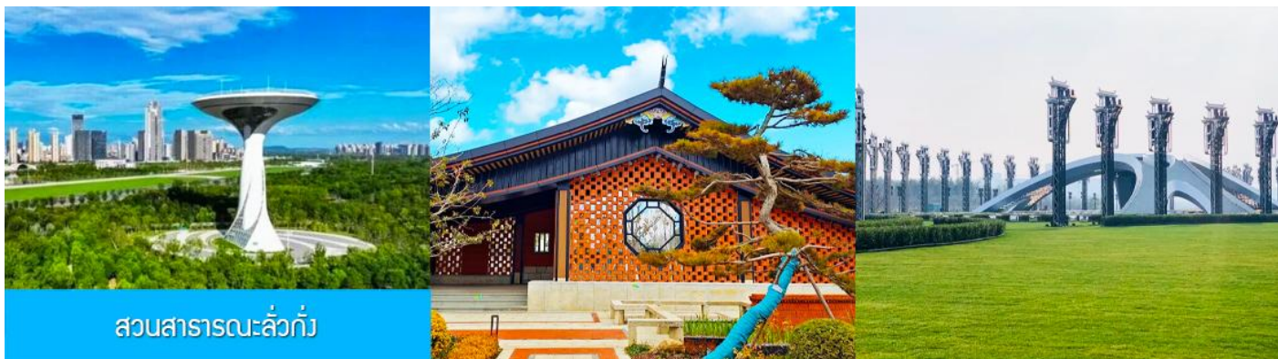
สวนสาธารณะลั่วกั๋ว

เช้า รับประทานอาหารเช้า ณ ห้องอาหารของโรงแรม (8)