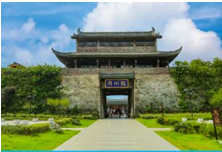
เมืองโบราณฮุยโจว

เช้า รับประทานอาหารเช้า ณ ห้องอาหารของโรงแรม (1)