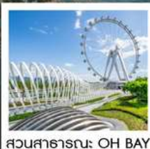
สวนสาธารณะ: OH BAY