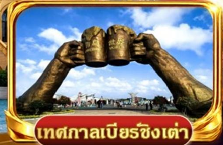
เทศกาลเบียร์ชิงเต่า