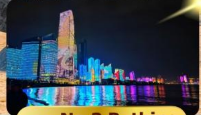
หาด No.3 Bathing

เมนูพิเศษ ซาบูสายพาน 6 วัน 4 คืน เดินทาง : พฤษภาคม 69