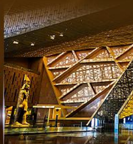
พิพิธภัณฑ์แกรนด์อียิปต์ (GEM)