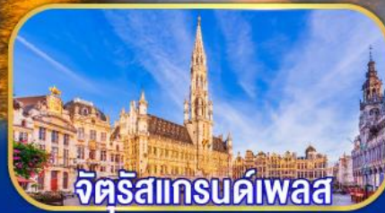
จัตุรัสแกรนด์เพลส