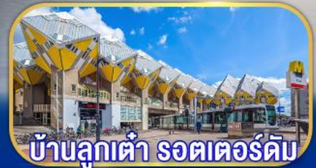
บ้านลูกเต่า รถเตอร์ดัม

เยือนเมืองเก่าแก่ยุโรป ทัชไฮไลต์กลุ่มประเทศเบเนลักซ์ กับการบินไทย บินตรงอัมสเตอร์ดัม