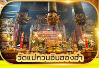
วัดแม่กวนอิมของฮ่า