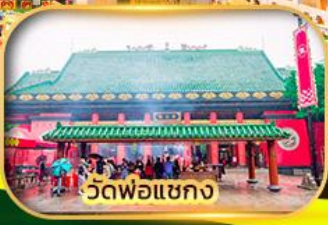
วัดพ่อแซกง