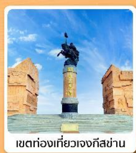
เขตท่องเที่ยวเจงกีสข่าน