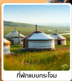
ที่พักแบบกระโจม