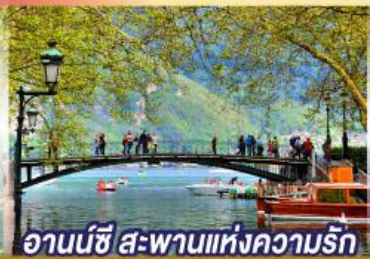
อานันชี สะพานแห่งความรัก