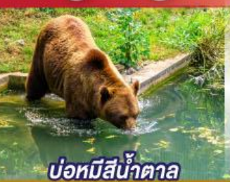
บ่อหมีสีน้ำตาล