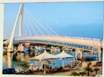
สะพานคู่รักตั้นสุ่ย