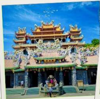
วัดกวนตู่