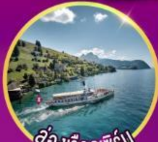
ล่องเรือลูซิิร์น