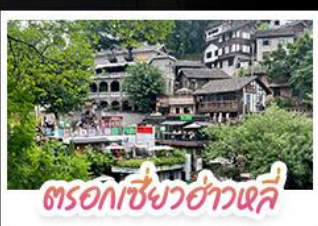
ตรอกเซียวฮ่าวเฉี