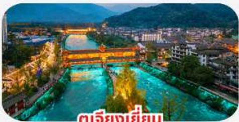
ตุเจียงเยียน