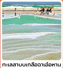
ทะเลสาบเกลือจาเอ้อหาน