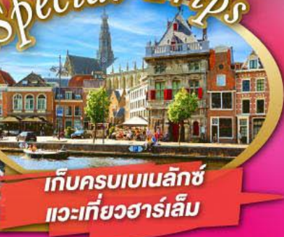
เก็บครบเบเนลักซ์ แวะเที่ยวฮาร์เล็ม